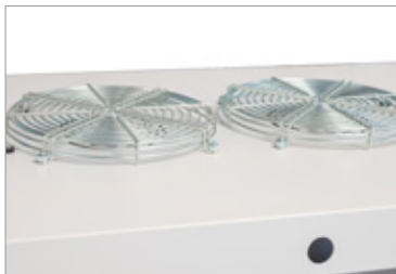
Thermostatgesteuerter Doppellüfter mit Abdeckgitter auf der Schrankoberseite