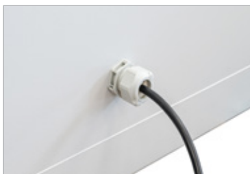
Zuleitung auf der Rückseite (3 Meter)