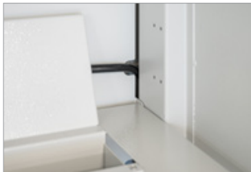
Saubere Kabelführung dank Kabelabdeckung in der Ecke, die alle sichtbaren Kabel verdeckt